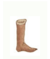
bas de laine femme

Comment s'appelle chacun de ces savons ?