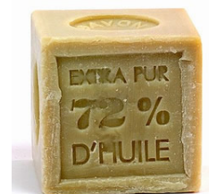
savon de Marseille